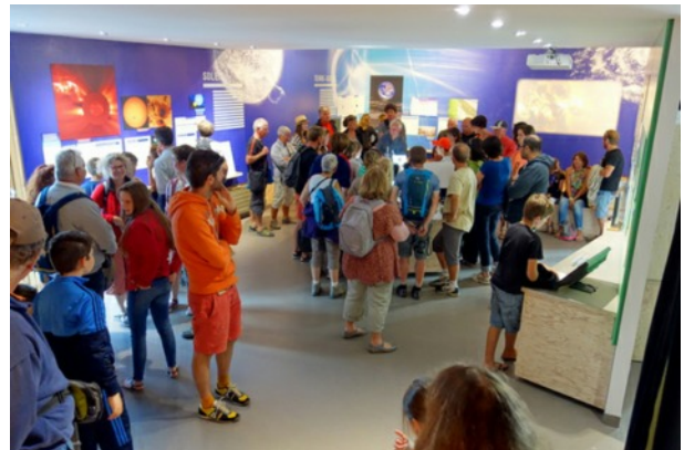
Beaucoup de visiteurs tout au long de l'été !

Les visites guidées et ateliers thématiques proposés tout au long de l'été ont enchanté les visiteurs. Ainsi, petits et grands ont pu exprimer leur créativité lors de la fabrication de cadrans solaires en plâtre ou carton et apprendre comment fabriquer soi-même une crème solaire. Ces ateliers ludiques ont également permis aux participants de comprendre les principes de la mesure du temps grâce au Soleil ainsi que les bénéfices (et dangers !) de son rayonnement sur notre santé.