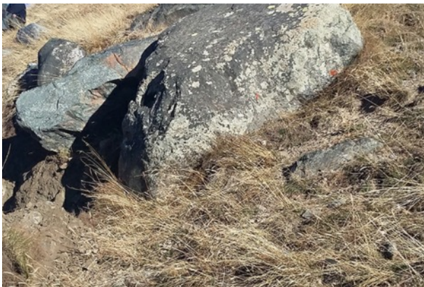
Des énormes rochers menaçaient de rouler sur le village

De gros rochers menaçaient la sécurité des habitants du village, surtout dans le quartier de Pierre-Belle. Nous avons donc fait appel à l'entreprise VALDOACRO TP de Villar Saint Pancrace qui est intervenue avec une pelle araignée durant une matinée de cet automne pour sécuriser le secteur.