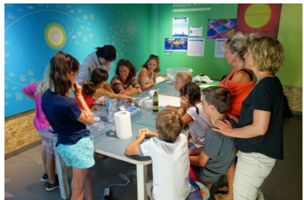
Atelier fabrication crème solaire

Au cours de la visite guidée qui débute par la vue panoramique sur Saint-Véran depuis la terrasse de la Maison du Soleil, les visiteurs découvrent les instruments astronomiques dédiés à l'observation de notre étoile. Ensuite, direction le Vaisseau Solaire où, confortablement installés, ils peuvent observer le Soleil en direct (ou presque car 8 minutes sont nécessaires à sa lumière pour parvenir jusqu'à nous !). Grâce à la magnifique météo de l'été, de superbes observations de notre étoile ont été faites : la photosphère et ses tâches, la chromosphère, de nombreuses protubérances et les visiteurs les plus chanceux ont même pu assister à des éruptions solaires. La visite se poursuit par une explication de l'analyse de la lumière des étoiles grâce à un spectrographe avec démonstration à l'appui. Enfin au rez-de-chaussée et à l'extérieur, la visite se veut interactive et de nombreuses expériences sont proposées aux visiteurs : expériences de décomposition de la lumière, jeux avec les couleurs sans oublier une partie consacrée aux énergies solaires (panneaux photovoltaïque, four solaire, voiture à hydrogène, robot solaire, etc.).