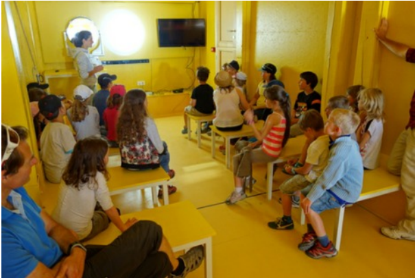
Les enfants de l'école de Ceillac captivés

Depuis son ouverture, la Maison du Soleil a accueilli quelques écoles du Queyras (Molines / Saint-Véran, Ceillac, Château-Ville-Vieille) et l'école Pasteur d'Embrun.