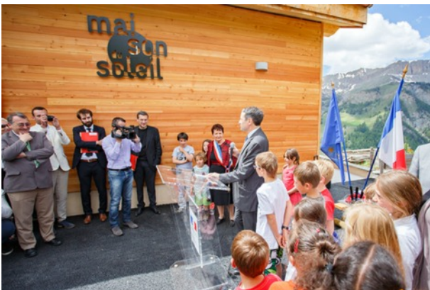
Discours de Monsieur Thierry Mandon