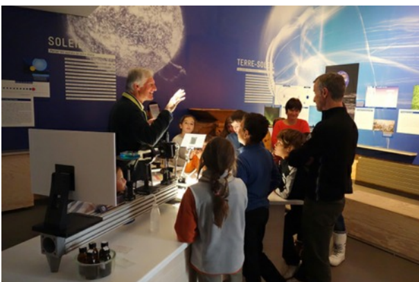
... Et expériences