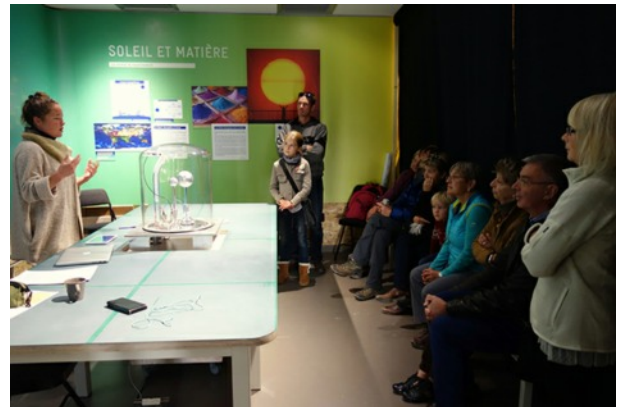
Explication du fonctionnement de la Planeterrella

La Maison du Soleil s'est récemment dotée d'un nouveau jouet : une Planeterrella qui permet de reproduire des aurores polaires sous cloche et qui, nous l'espérons, ravira petits et grands cet hiver.