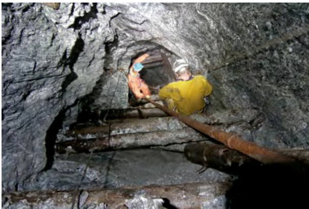
Zone où l'escalier en bois s'est décroché

L'objectif est double : permettre à nouveau d'autres missions de fouilles programmées, et permettre la faisabilité d'une petite étude d'opportunité d'une ouverture de galerie au grand public.