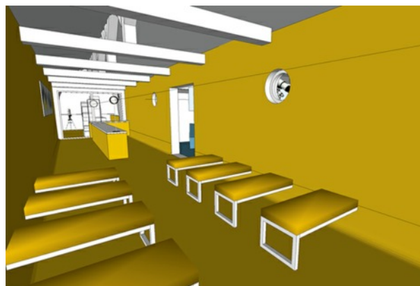
Le vaisseau solaire

très grand diamètre grâce à un cœlostat ; un spectacle unique !