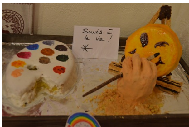
... Tout comme les gâteaux...