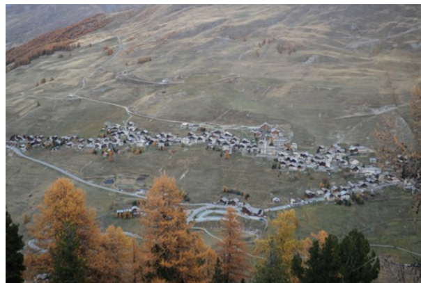
C'est vrai la photo est petite ! Mais avez-vous trouvé ?

À Saint-Véran ce sont deux toits qui ont pu être équipés ; mais au fait ! Où sont-ils ? Avec l'œil vous pourrez les retrouver sur la photo.