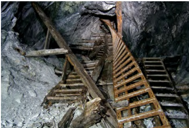
Base effondrée du grand escalier

Il s'agissait donc de pénétrer dans la Mine pour voir si d'autres désordres ont eu lieu entre temps. Ce fut aussi l'occasion de sécuriser les lieux en changeant les cordes fixes et autres ancrages et d'effectuer diverses réparations.