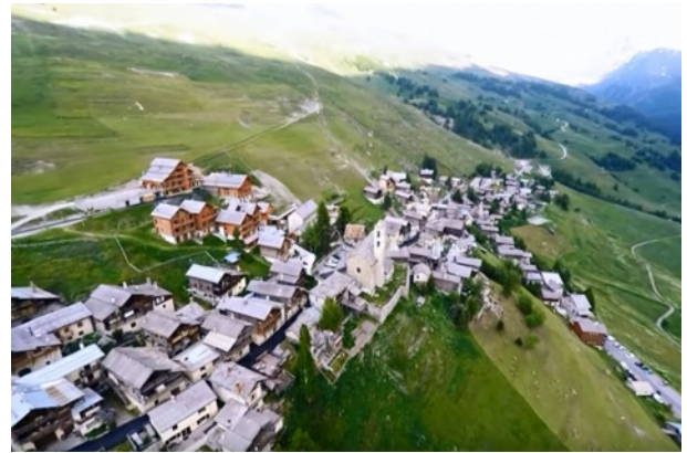
La réfection de la rue vue du ciel

Le chantier de la voirie de la Ville et du Chalelet s'est terminé dans les délais, nous remercions encore, les habitants des deux quartiers pour leur patience.