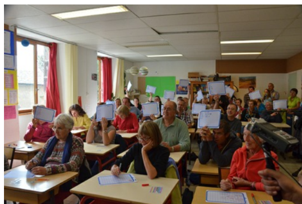
... Et les grands élèves

Un grand « coup de chapeau », à tous nos bénévoles qui se raréfient, bien courageux devant l'ampleur de la tâche donc vraiment un grand merci à eux !