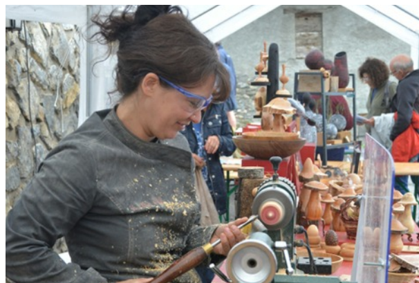
Des exposants souriants...

culture générale très prisé et... aucun bonnet d'âne. N'oublions pas tous les exposants qui ont bravé le mauvais temps pour nous faire partager le temps de quelques heures leurs métiers et passions.