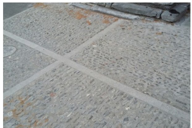
La calade de l'église

La dernière phase des travaux, à savoir le caniveau central et l'hydro décapage du bitume sera réalisée au printemps.