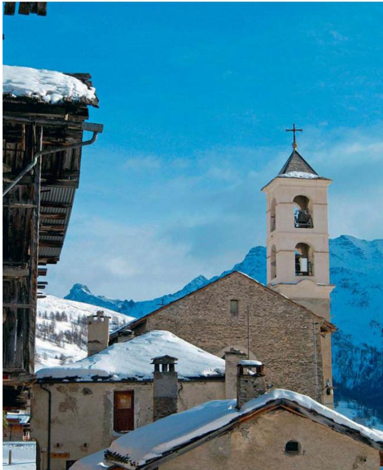
OFFICE DE TOURISME DE SAINT-VÉRAN