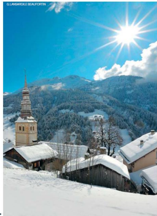
G. LANGSARD/LE BEAUFORTIN

www.arèches-beaufort.com et www.lessaisies.com