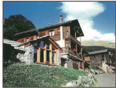
Chalet "La Fontaine du Cembra"

Quartier Pierre-Belle 05350 SAINT-VÉРАН e-mail : samjueyras@hotmail.com